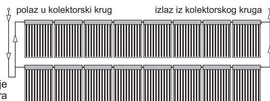
Skica: Moguće spajanje više serija po 8 kolektora

U seriju se spaja max. 8 kolektora. Za veće kolektorske sustave spajanje se vrši paralelno više serija po 8 kolektora.