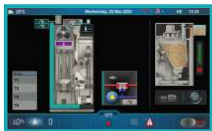
Multifunkcijska digitalna regulacija sa 7" ekranom osjetljivim na dodir