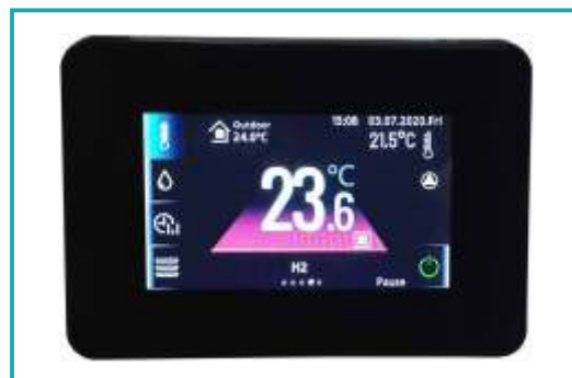
Regulacija u boji s ekranom osjetljivim na dodir